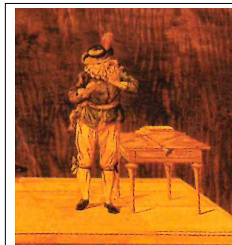
David Roentgen (1743 – 1807)

Le tracé d'exécution, élaboré à partir de documents originaux et de relevés in-situ, vous est fourni par votre chef d'atelier.